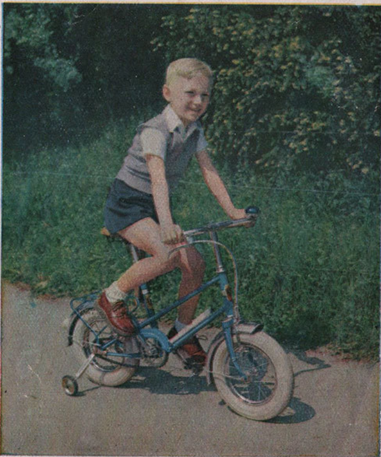
LA BICYCLETTE ENFANT